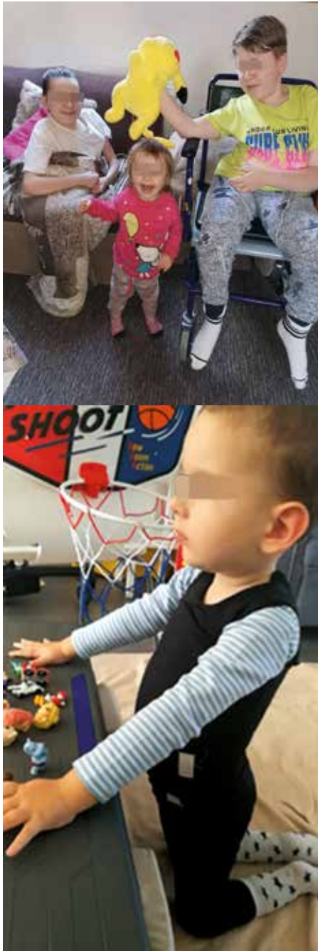
Obr. 3. A: presymptomatická pacientka SMA typ II a symptomatickí neliečení starší súrodenci; B: pacient s SMA II na liečbe, ktorá začala už pri rozvinutom ochorení

sa jeho aktuálny stav, ventilačné a motorické schopnosti (pomocou motorických škál) – a po získaní súhlasu od príslušnej zdravotnej poisťovne je u neho možné okamžite začať liečbu. Potvrdenie diagnózy na genetickej úrovni pre typ SMA I je urgentná situácia, keďže dieťa je ohrozené ventilačným zlyhaním. Z tohto dôvodu je pre nás významná otázka novorodeneckého skríningu, ktorá by situáciu mohla riešiť bez zbytočného zdržania. Spolu so Skriningovým centrom novorodencov v Banskej Bystrici pripravujeme pilotný